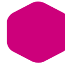
Cyclamen 255 233 C