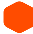
Orange 250 1655 C