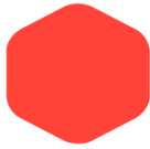
Scarlet Red 251 WARM RED C