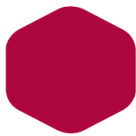
Pure Fuxia 901 1945 C