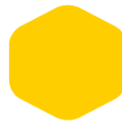
Golden Yellow 154 116 C