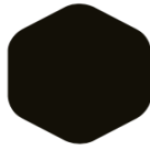
Extra Black 051 Black C