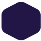
Pure Violet 902 275 C