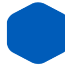
Medium Blue 455 300 C