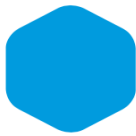
Light Blue 450 2925 C