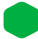
Light Green 350 354 C