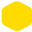
Medium Yellow 153 108 C