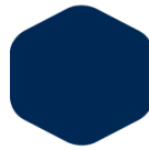
Dark Blue 454 295 C