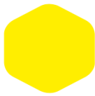
Primrose Yellow 152 YELLOW C