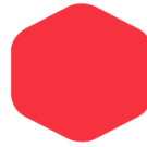
Bright Red 254 032 C