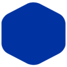
Ultramarine Blue 452 286 C